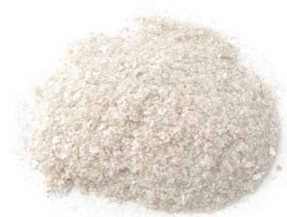
Keramik - Glasuren/Fritten (SiO 2 ), D 50 = 100µm